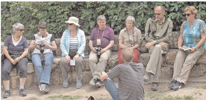
Besinnung an den Jordanquellen.