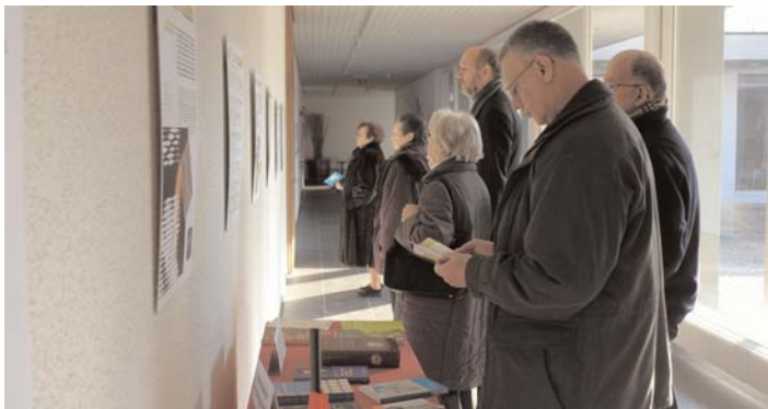
Calvin-Ausstellung im Zentrum Glaubten