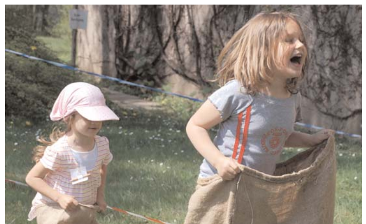
«Sackgumpen im Tageslager»

Musste im Sommer mangels Teilnahme sistiert werden.