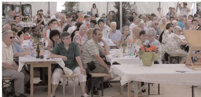
Nordstadtfest: Gottesdienst im Zelt

* Bei Redaktionsschluss noch keine Angaben vorhanden.