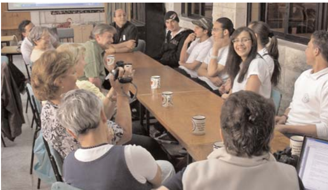
Informationen über den Stand der Arbeiten bei einem von uns gesponserten Projekt.