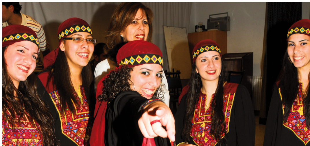
Dabkeh: Tanz und Chor