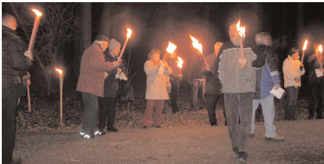
Waldweihnacht 2007 im Hürstwald