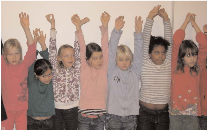
Proben für die Zäller Wiehnacht

■ Ein Krippenspiel von Paul Burkhard aus dem Jahre 1961 am Sonntag, 13. Dezember, um 17 Uhr, in der Kirche Glaubten.