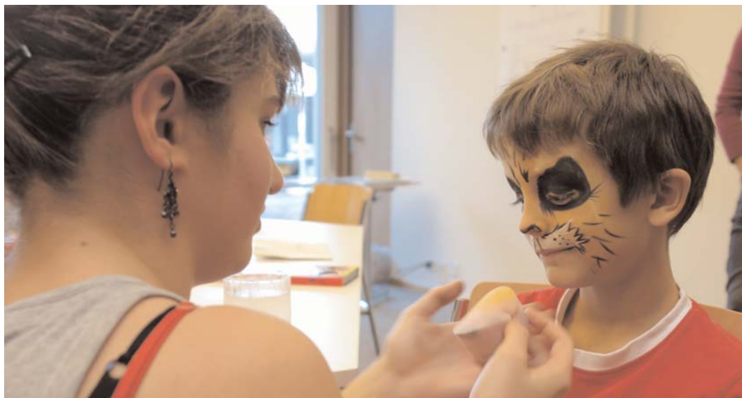
Kinder am Marktfest 2008