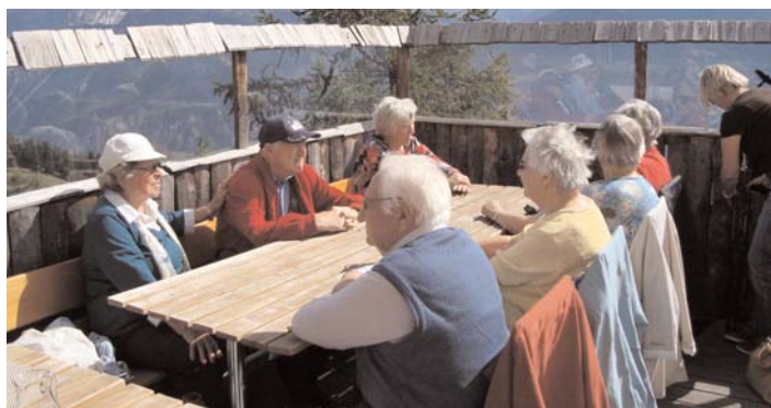
Auf der Sonntertasse in Merbé (2000)

■ Vom 14. bis 19. September genossen 24 Seniorinnen und 4 Senioren sonnige Tage in den Bergen.