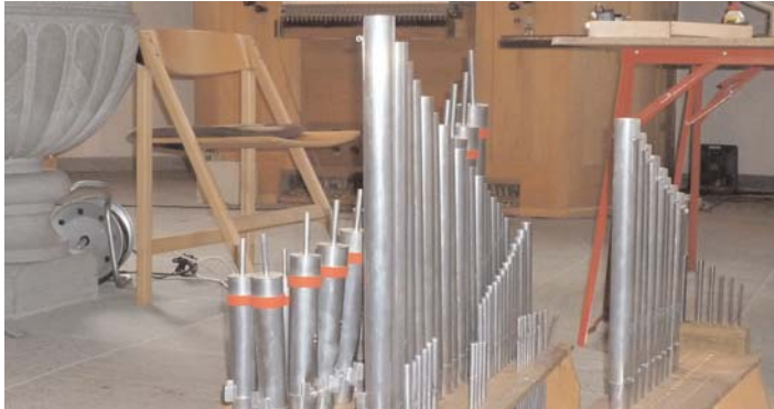
Orgelrevision in der Kirche Unterdorf

■ Orgelkonzert mit Werken von Carl Philipp Emanuel Bach und Giovanni Battista Sammartini am Sonntag, 1. November, 17 Uhr, Kirche Unterdorf.