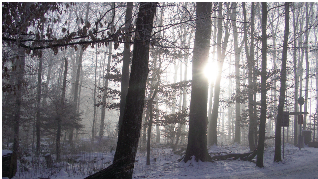
Winterstimmung beim Katzensee