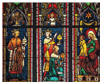
SGlasfenster in der Klosterkirche Königsfelden

■ Der Dreikönigstag am 6. Januar bildet den Abschluss der Weihnachtszeit.