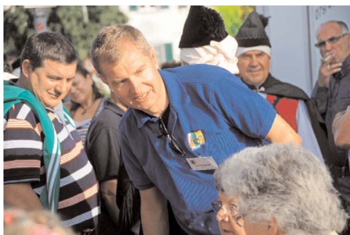
«Was hätten Sie gerne?»