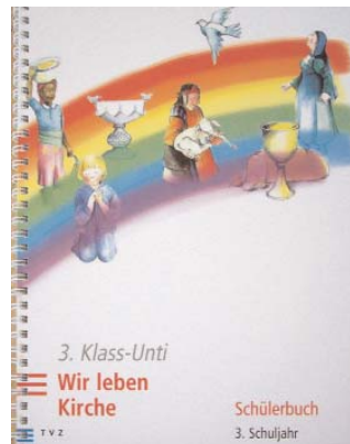
Ausschnitt aus dem Untibuch

■ 24 Schülerinnen und Schüler im reformierten Drittklassunterricht